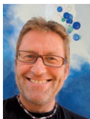
HC Medlien Tankevekker