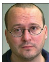
Dag Thorenfeldt Norges frakkeste portrettfotograf